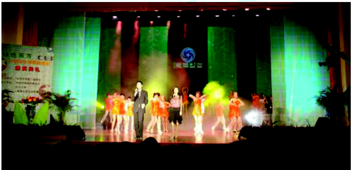
我会举行环境保护宣传活动

环境保护是一项意义深远的公益事业。人人有权享受优美的环境，优美的环境又需要大家来关心和爱护。中华环境保护基金会衷心地希望与国内外热心环境保护事业的组织和个人建立友好联系，相互支持与合作，共同致力于保护人类赖以生存的环境。