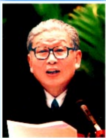
中华环境保护基金会副理事长 林宗棠