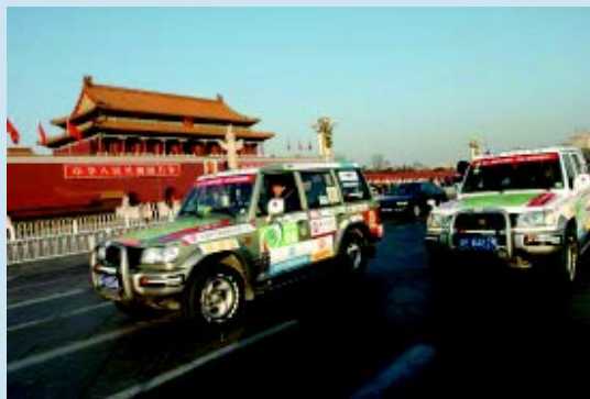
北京——香港环保宣传活动车队

曲格平、国家环保总局王玉庆副局长和内蒙、陕西有关领导，神东煤田1千多干部群众出席了启动仪式，并表演了地方特色的文艺节目，为启动仪式增添了喜庆的气氛。东方卫视台对启动仪式进行了1个半小时的实况播出。绿色东方——2005年中华环境奖评选工作按照规定的程序，经过推荐、评选委员会的评选，已产生了2005年中华环境奖和绿色东方——2005年中华环境奖获奖者名单，待组织委员会批准后，于2006年年初在人民大会堂举行颁奖典礼。