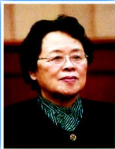
中华环境保护基金会副理事长 刘恕