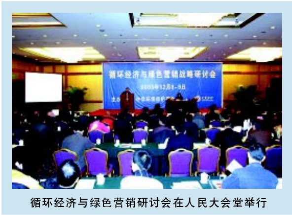
循环经济与绿色营销研讨会在人民大会堂举行

会、全国政协人口资源环境委员会、国家环保总局的代表、学术界、知名专家、企业等 200 多人出席了会议，共同研讨循环经济及绿色营销策略有关问题。会上，华晨金杯，奥的斯，联想，北京汇源，上海朵彩等企业的 29 项产品型号获得了 2005 年度中华环境保护基金会“绿色产品奖”荣誉受到大会表彰，同时受表彰的还有支持环保基金会公益事业的 67 家捐赠单位。