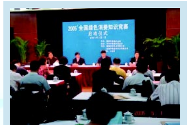
绿色消费知识竞赛启动仪式在北京举行

为倡导绿色消费，大力宣传环境保护知识，我会于2005年“6.5”世界环境日期间，举行了全国性“绿色消费知识竞赛活动”。该活动被列入了国家环境保护总局2005年度宣传重点工作。此次竞赛的内容涉及到绿色生活和绿色消费理念题、衣物衣饰方面污染知识和消费知识题、饮食方面污染知识和消费知识题、家居环境污染知识和消费知识题、出行方面的环境污染知识和消费知识题、工业生产消费题、农村污染和农业生产消费知识题、文化、教育消费知识题、节能降耗题、环境标识和环境方面认证知识题，题目力求通俗易懂，百姓喜闻乐见，少有专业技术性强的题目。我会还特别活动编写出版了《绿色消费知识手册》，免费赠送给活动参与者、合作单位、所有来基金会访问的热心人、参与积极分子和志愿者。宣传受益人群覆盖了除港、澳、台外全国30个省、直辖市，回收题卷近18000份。26个以单位、社团组织或个人组织集体参赛的答卷，按照得分排列，在相同分数抽奖的方式产生了一等奖5名，二等奖15名，三等奖30名，参与奖100名以及优秀组织奖。