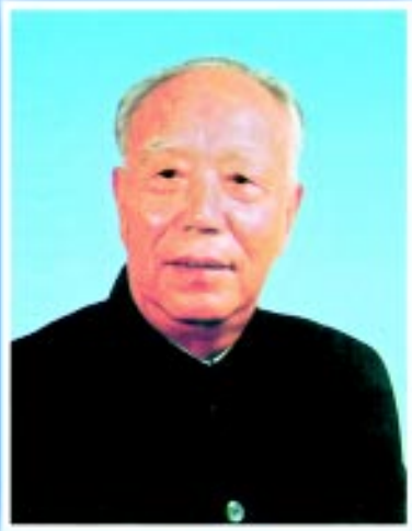
中华环境保护基金会名誉理事长 万里