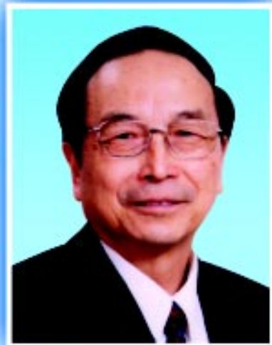
中华环境保护基金会名誉理事长 蒋正华