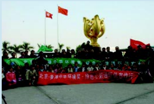
北京——香港环保宣传活动在香港举行