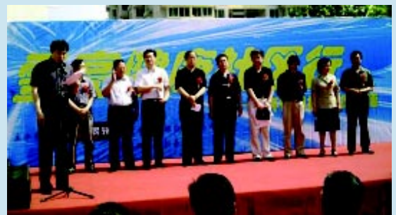
“小康幸福工程”在北京举行宣传活动

我会与北京市园林局共同开展的京城古树保护第三期活动于9月正式启动，“绿色使者”李冰冰、黄安、陈琳参与了古树保护宣传片的拍摄。该宣传片在北京电视台、北