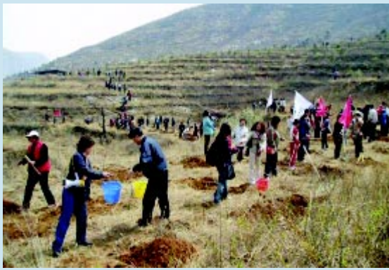
“中华绿色版图工程” 举行植树活动

产业公司在北京王府井女子百货商厦厦门广场举行了“中华绿色版图工程——为节能环保献力”公益活动揭幕仪式及向我会公益活动捐赠开箱仪式。活动现场进行了募捐开箱仪式及消费者节能知识问答活动。