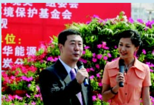
著名电视节目主持人方宏进主持“中华环境奖”启动仪式

为适应环境保护工作发展的新形势，促进科学发展观的进一步落实，2005年8月，我会全面启动了“绿色东方——2005年中华环境奖即第三届中华环境奖评选、表彰和宣传活动”，将原来每届设立的5名中华环境奖获奖者的奖金由10万元增加到50万元。另围绕5个中华环境奖项类别设立了20名绿色东方奖，每名奖金5万元，年度奖金达到350万元人民币。并且由原定每两年进行一次评选工作改为每年进行一次。