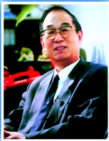
中华环境保护基金会理事长 曲格平