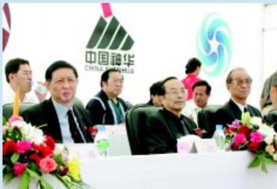
蒋正华副委员长、曲格平理事长、王玉庆副局长出席第三届“中华环境奖”启动仪式

“传活动”启动仪式于8月20日在我新兴的特大型能源基地——神东煤田隆重举行，全国人大常委会蒋正华副委员长和中华环境奖组委会主任、中华环境保护基金会理事长