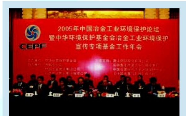
冶金工业环保论坛在人民大会堂举行

2005 年中国冶金工业环境保护论坛暨中华环境保护基金会冶金工业环境保护宣传专项基金工作年会于12月3日在北京人民大会堂召开。全国政协副主席阿不来提·阿不都热西、原全国人大常委会副委员长布赫等领导到会祝贺。