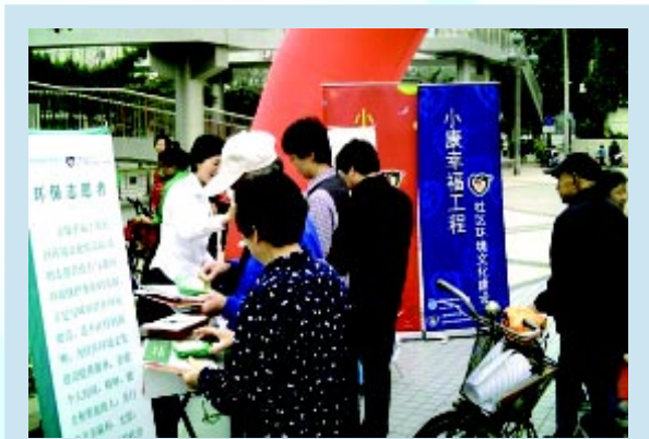
“小康幸福工程”进入社区

为落实党中央“以人为本，全面建设小康社会，促进人与自然和谐发展”的号召，我会在北京市的部分社区开展了以“环保、健康、科技”为主题的“百家社区环保健康公益行动”。