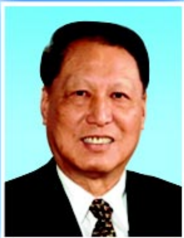
中华环境保护基金会名誉理事长 成思危