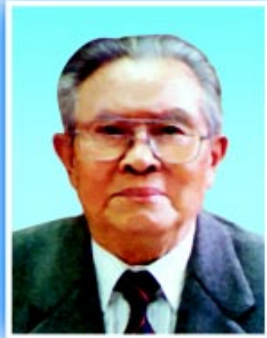
中华环境保护基金会名誉理事长 黄华