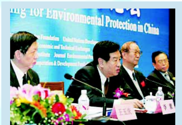
全国政协李蒙副主席、曲格平理事长、王玉庆副局长出席论坛开幕式

由中华环保基金会、中国国际经济技术交流中心、联合国开发计划署（UNDP）共同主办的“2005 中国环保投资融资国际论坛”3月29日在北京举行。全国政协副主席李蒙、中华环保基金会理事长曲格平、国家环保总局副局长王玉庆、中华环境联合会（筹）秘书长曾晓东等出席开幕式。