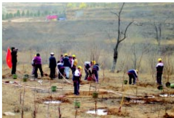
东西部“1+1”植树助学活动

该活动是我会主办的一项公益项目。4 月 8 日，我会与《北京娱乐信报》举办了东西部“1+1”植树助学活动。近 500 名信报读者来到房山区大石窝镇后石门村燕家峪，