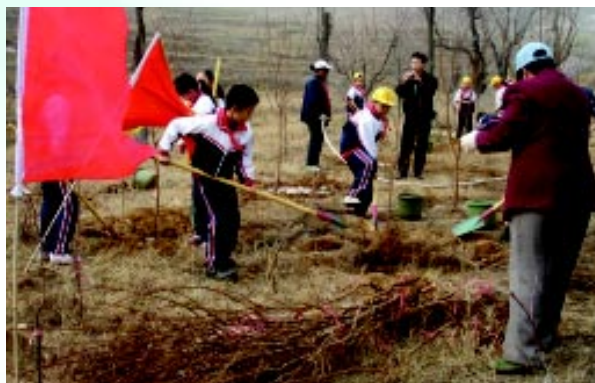
我会组织植树绿化公益活动

《绿缘》内部刊物的编辑发行向社会宣传我会的工作和活动情况，传递环保信息，动员社会力量参加到环境保护事业中来，为共同做好我国的环保公益事业而努力。