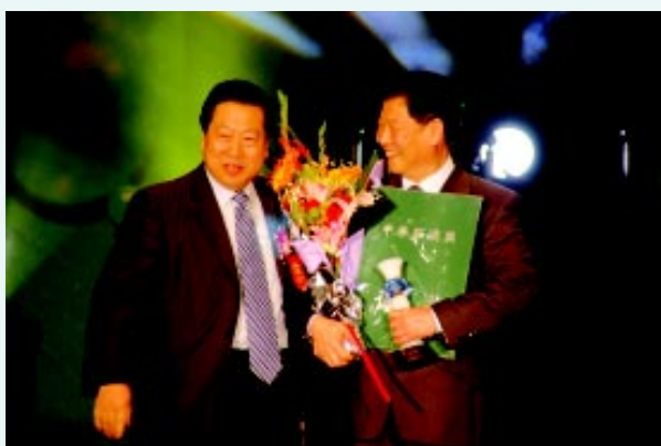
国家环保总局周生贤局长向获奖者颁奖