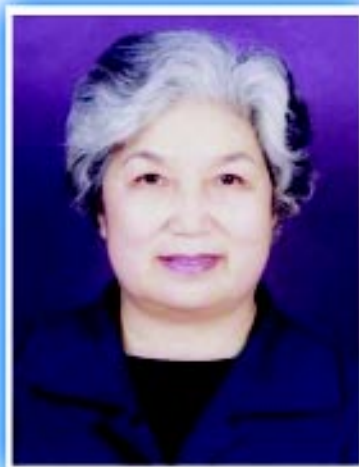
中华环境保护基金会副理事长：王涛