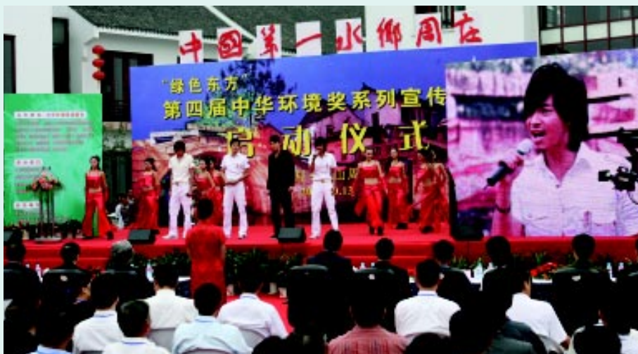
我会举行环境保护公益宣传活动

保护基金会章程（修订稿）；审议并原则通过了《中华环境保护基金会理事会议事规则》；会议听取了《中华环境保护基金会2006年工作计划》的报告；并通过了第三届理事会“向第二届理事会全体理事的致敬信”。出席会议的全体理事就如何充分发挥中华环保基金会的社会影响力，拓展渠道，广开资源，树立优势项目品牌，增强本会的资金募集能力，以及进一步加强基金会开展环保公益活动的能力等方面，发表了各自的意见和提出了积极的建议。曲格平理事长做了会议总结，并对新一届理事会及我会今后的工作提出了要求和希望。