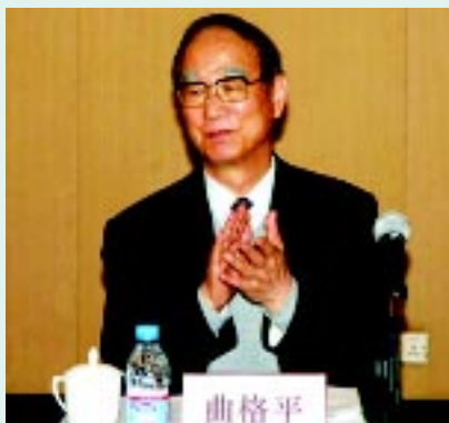
曲格平理事长出席第三届理事会会议

月20日中华环保基金会第三届理事会会议在北京举行。国家环保总局王玉庆副局长主持会议并讲话。会议听取了中华环保基金会工作汇报，选举产生了中华环境保护基金会第三届理事会，理事会由20名理事组成。曲格平当选为第三届理事会理事长，汪纪戎、谢企华、王涛当选为副理事长。第三届理事会第一次会议受曲格平理事长的委托，由汪纪戎副理事长主持。会议审议并原则通过了《中华环境