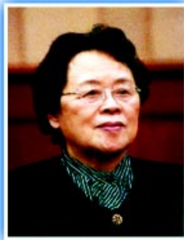
中华环境保护基金会名誉副理事长：刘恕