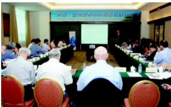
我会举行冷媒、空调技术与环保责任研讨会

为交流和探讨节能和环保技术的最新进展情况，探讨冷媒、空调生产企业的环保责任，促进我国节能和环保技术的发展。我会于9月21日在京举办了“冷媒、空调技术与环保责任研讨会”。与会专家一致认为，我国既是制冷空调使用大国，又是煤炭资源消耗大国，对全球生态环境保护负有一定的责任和义务。但我国又是发展中国家，应根据我国实际国情以及自身特点，全面权衡安全、环境、能