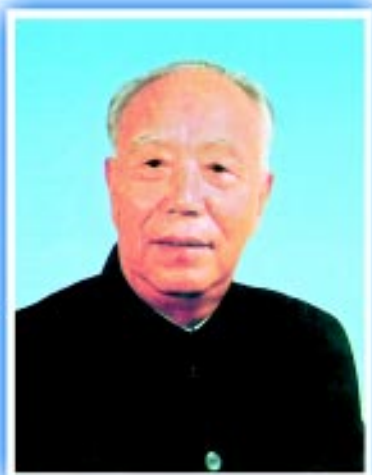
中华环境保护基金会名誉理事长：万里