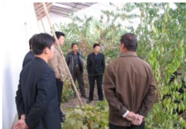
“四位一体”生态农业示范建设项目现场考察

生态示范小区现已平整土地 130 亩，铺垫砂石路 1700 米，建成 1.5 万立方米蓄水池 1 座，衬砌渠道 3000 米，小区内水、电、路基础设施建设已完成。2006 年已建成 4 座日光温室大棚，产生的收益将用于该项目的进一步发展及推广工作，以求达到改善农村社区生态环境和生活环境、带动农民脱贫致富、建设可持续发展新农村的目标。