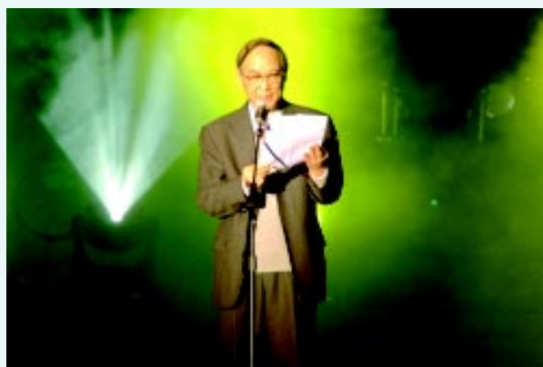
中华环境保护基金会曲格平理事长致辞