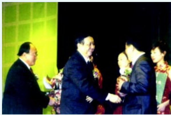
国家环保总局王玉庆副局长向获奖者颁奖