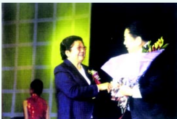
全国人大常委会顾秀莲副委员长为包头市代表苏青市长颁奖