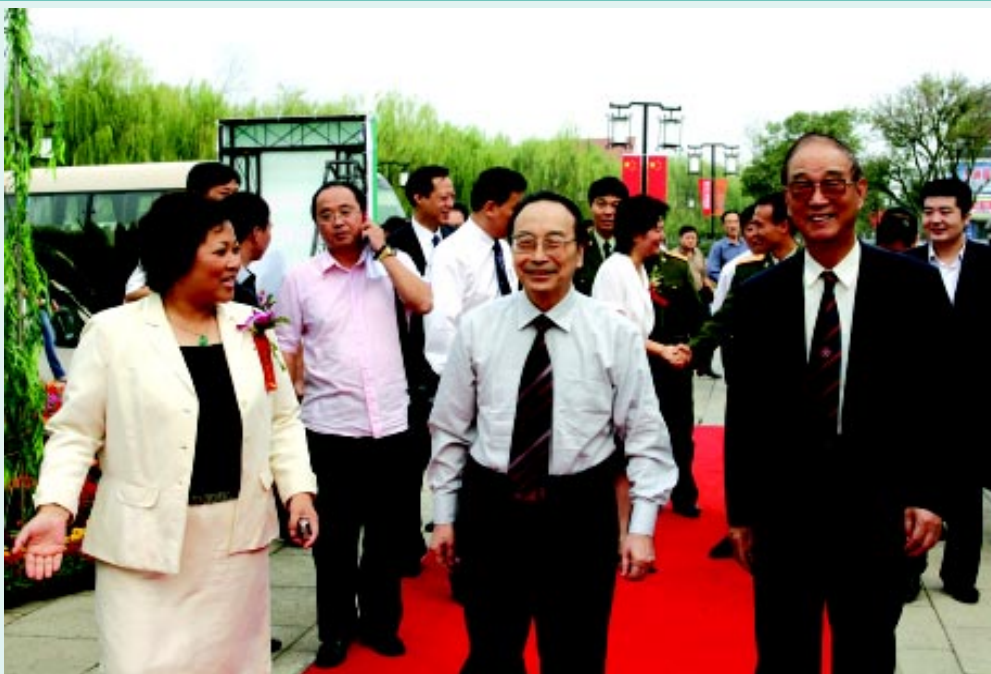
全国人大副委员长蒋正华和中华环境奖组委会主任曲格平出席第四届中华环境奖系列宣传活动启动仪式