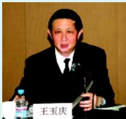
国家环保总局王玉庆副局长出席第三届理事会会议

月20日中华环保基金会第三届理事会会议在北京举行。国家环保总局王玉庆副局长主持会议并讲话。会议听取了中华环保基金会工作汇报，选举产生了中华环境保护基金会第三届理事会，理事会由20名理事组成。曲格平当选为第三届理事会理事长，汪纪戎、谢企华、王涛当选为副理事长。第三届理事会第一次会议受曲格平理事长的委托，由汪纪戎副理事长主持。会议审议并原则通过了《中华环境