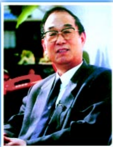
中华环境保护基金会理事长：曲格平