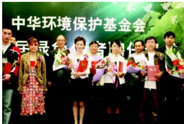
我会举行“绿色使者”聘任仪式活动

为了进一步做好环境保护宣传工作，4月27日，在我会成立13周年之日，我会举行了“第五届绿色使者聘任仪式”。中国歌舞团一级演员王文莉、创作型歌手崔菲菲、超级女声纪敏佳、青年演员彭心宜、著名篮球运动员张云松、北京新闻著名主播王小佳、中国复合油版画独特画种创造人于成松获得中华环境保护基金会第五届绿色使者。仪式上，绿色使者及其推荐公司代表宣读了承诺书，承诺在任期言行上履行环保义务，支持环保活动，创作环保作品等。我会理事长曲格平、名誉副理事长巴忠倓、共青团中央书