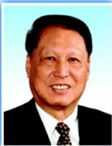
中华环境保护基金会名誉理事长：成思危