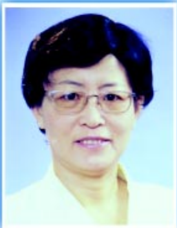
中华环境保护基金会副理事长：汪纪戎