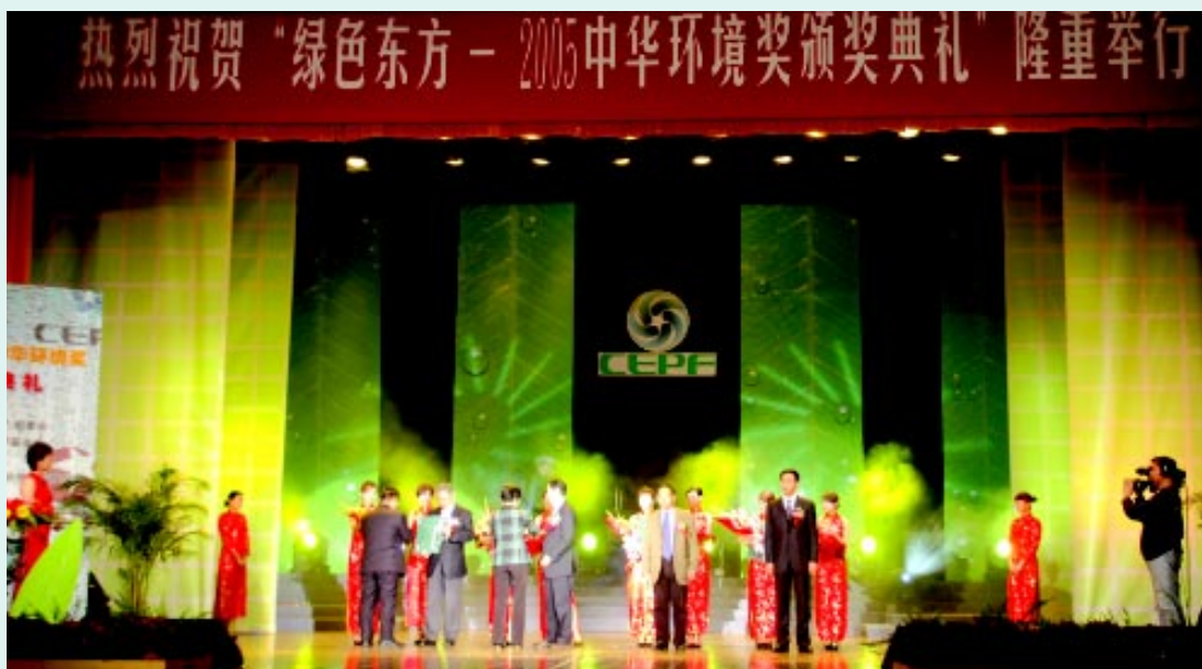
我会在北京人民大会堂举办“绿色东方—2005 中华环境奖颁奖典礼”

北京中维会计师事务所有限责任公司对中华环境保护基金会 2006 年度的资产总负债表与截止该日的年度业务活动表、财务状况表及有关会计资料进行审计后，提出了关于中华环境保护基金会 2006 年度审计报告（中维审字[2007 第 009 号]）：“我们认为，上述会计报表符合国家颁布的《民间非营利组织会计制度》的规定，在所有重大方面公允反映了贵单位 2006 年 12 月 31 日的财务状况。”