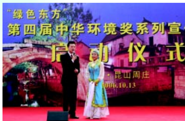
第四届中华环境奖系列宣传活动在昆山市周庄隆重举行

第四届中华环境奖评选工作已完成推荐材料分类、整理工作，准备提交评选委员会进行评选工作，表彰活动计划于明年进行。中华环境奖评选、表彰活动的继续举行，将进一步激励社会各界关心和参与环境保护的积极性。