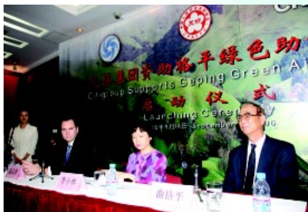
花旗集团资助格平绿色助学行动启动仪式