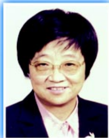
中华环境保护基金会副理事长：谢企华