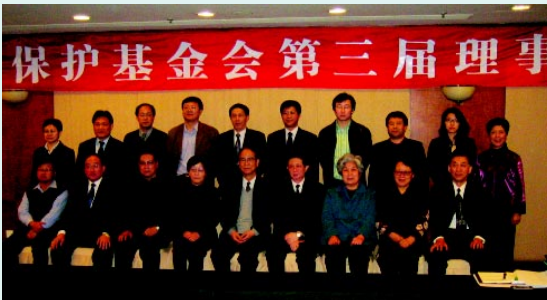
出席第三届理事会会议的领导和理事合影